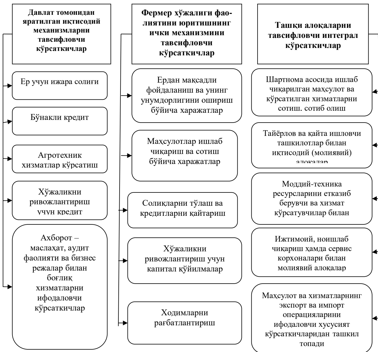
1-расм. Хусусий кўрсаткичлардан ташкил топган интеграл кўрсаткичлар

Кўп тармоқли фермер хўжаликлари фаолиятини тавсифловчи интеграл кўрсаткичлар ўзаро боғлиқ бўлиб, бир интеграл кўрсаткичнинг ўзгариши албатта бошқа кўрсаткични ўзгаришига олиб келади. Бундай ҳолат мураккаб тизимларга хос бўлиб, уни ўрганиш фанда тизимли ёндашув деб аталувчи усулларни қўллашни талаб этади [8].