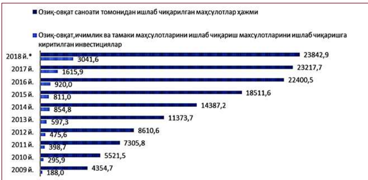
1-расм. Озиқ-овқат саноатига киритилган инвестициялар ва унда ишлаб чиқилган маҳсулотлари ҳажми, млрд. сўм.

Юқори технологияли ишлаб чиқаришларни ривожлантиришга тўғридан-тўғри қўйилмалар киритаётган хорижий инвесторлар учун максимал даражада қулай инвестиция муҳитини яратиш, республика минтақаларига хорижий сармоялар ва замонавий технологиялар жалб этилиши рағбатлантирилишини кучайтириш, хорижий инвесторлар ҳамда хорижий инвестициялар иштирокидаги корхоналар учун қафолатлар ва имтиёзлар тизимини янада мустаҳкамлаш мақсадида қонун ҳужжатларига бир қатор ўзгариш ва қўшимчалар киритилдики, бу ўз навбатида мамлакатимизнинг инвестицион жозибадорлигини оширишга хизмат қилмоқда [2] (1-расм).