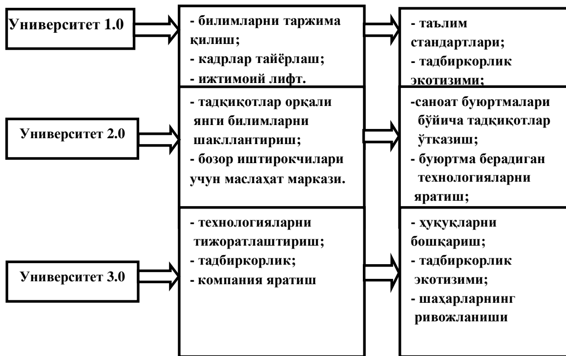
1-расм. Университет 1, 2, 3 моделлари шакллари

Жаҳон тажрибасидан маълумки, талабаларни ўқитишнинг «Университет 1.0» модели фақат таълим бериш билан чекланади, «Университет 2.0» модели таълим бериш ва илмий тадқиқот ишлари олиб боришни ўз ичига олади. Жаҳоннинг илғор давлатлари ўқув юртларида қўлланилаётган «Университет 3.0» моделида эса университетлар ўз фаолияти даврида олимлар, илмий изланувчилар ва талабалар иштирокида яратилган илмий ишланмалар ва илмий-тадқиқотлари натижаларини ўзлари сотиш имкониятига эгадирлар (1).