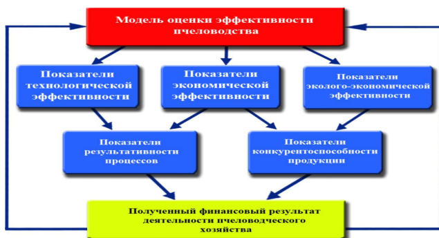
Рисунок 2 - Модель оценки эффективности управления пчеловодческого хозяйства.

ского хозяйства необходима система взаимосвязанных показателей, каждый из которых синтезирует объективные возможности предприятия. В ходе исследования была разработана модель проведения такой оценки (рис.2.).