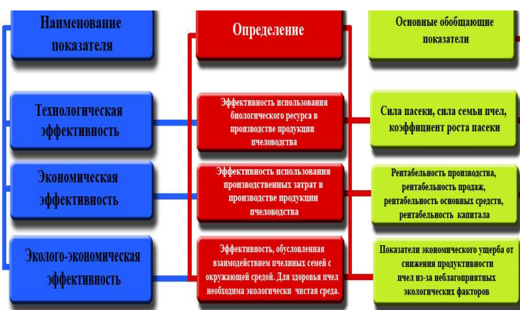
Рисунок 1. Виды и характеристики показателей эффективности управления пчеловодством.

В качестве критерия технологической эффективности определен обобщающий показатель «сила пчелосемьи», так как этот показатель является комплексным и учитывает затраты на проведение инновационных, экологических, зоотехнических, технологических, агротехнических и организационных мероприятий в течение всего активного жизненного цикла семей пчел.