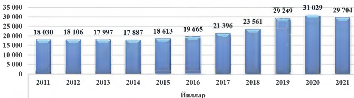
2-чизма. Қандолат маҳсулотлари ишлаб чиқаруви корхоналарида ишчи-ходимлар сонининг ўзгариш тенденциялари 2 .

кўрсаткич, бу уларда ишловчи ишчилар сонининг ўзгариш тенденциясидир. Қандолат маҳсулотлари ишлаб чиқаруви корхоналарида ходимлар сонининг ўзгариш тенденциялари 2-чизмада келтирилган.