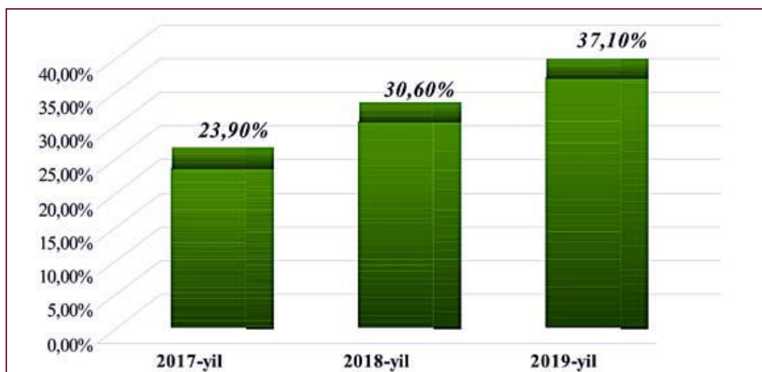
2-rasm. Yalpi ichki mahsulotga nisbatan asosiy kapitalga o'zlashtirilgan investitsiyalar (foizda). 1

2019-yilda Yalpi ichki mahsulotga nisbatan asosiy kapitalga o'zlashtirilgan investitsiyalar – 37,1 % ni tashkil etib, 2018-yildagi ko'rsatkichiga nisbatan 6,5 % punktga ko'paydi. Mazkur ko'rsatkich 2017-yilda 23,9 % ni hamda 2018-yilda – 30,6 % ni tashkil etgan.