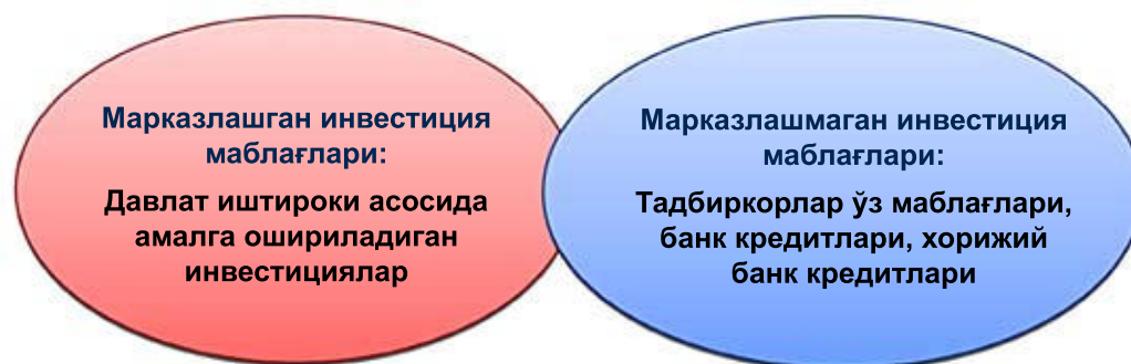
2-расм. Инвестиция маблағларининг капитал қўйилмалари бўйича ажратилиши.

Инвестицион лойиҳалар самарадорлигини аниқлашда самарадорликни аниқлаш ва кўрсаткичларни танлаб олишга алоҳида эътибор бериш лозим. Чунки бу кўрсаткичлар асосий молиявий кўрсаткичлар ҳисобланилади. Бундан ташқари инвестицион жозибдорликка бир қатор омиллар таъсир кўрсатади (3-расм).