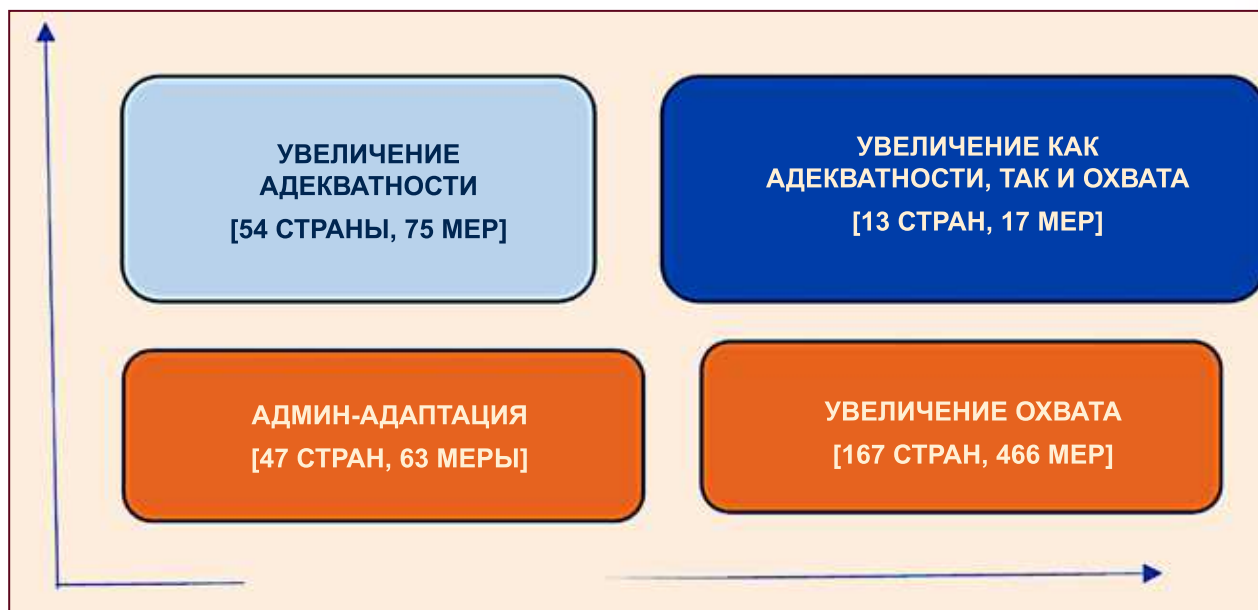
Рис.2. Адаптации денежных выплат к кризису в мире.