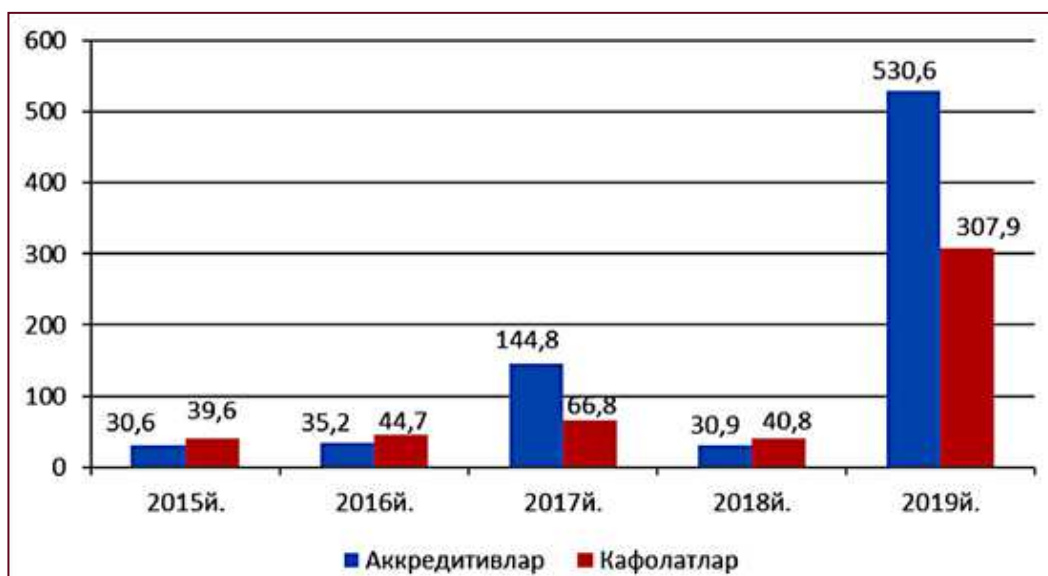
3-расм. АТ «Агробанк» томонидан қишлоқ хўжалик маҳсулотлари экспортчиларига очилган ҳужжатлаштирилган аккредитивлар ва уларга берилган кафолатлар [7], млрд. сўм.

Мазкур кафолатлар суммаси 2018 йилда 2017 йилга нисбатан сезиларли даражада камайгани ҳолда, 2019 йилда 2018 йилга нисбатан кескин ошган. Бу эса, қишлоқ хўжалиги маҳсулотлари экспортини молиялаштириш амалиётини такомиллаштириш нуқтаи-назаридан ижобий ҳолат ҳисобланади.