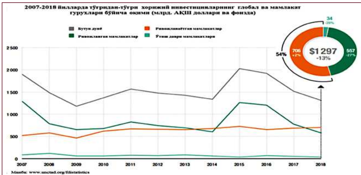
1-расм. 2007–2018 йилларда ТТХИларнинг глобал ва мамлакат гуруҳлари бўйича оқими (млрд. АҚШ доллари ва фоизда)[2].

ЮНКТАД 1 ҳисоботлари маълумотларига қараганда, 2018 йилда тўғридан-тўғри хорижий инвестициялар (ТТХИ)нинг жаҳондаги глобал оқими ўтган йилга нисбатан 13 фоизга камайиб 1 трлн. 297 млрд. АҚШ долларини ташкил этди (1-расм). Бунинг асосий сабаби ривожланган мамлакатларда тўғридан-тўғри капитал оқимининг пасайиши, деб топилди. Капитал оқимининг пасайишига асосан, 2017 йилда АҚШ Президенти Дональд Трамп томонидан солиқ ислохотларининг ўтказилиши (яъни, корпорация солиқларининг 35% дан 21 % га туширилиши) ва транс миллий корпорациялар томонидан маблағларни кенг қўламли репатриация қилиниши билан боғлиқ бўлди [2].