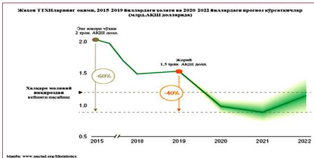
3-расм. Жаҳон ТТХИларнинг оқими, 2015–2019 йиллардаги ҳолати ва 2020–2022 йиллардаги прогноз кўрсаткичлар (млрд.АҚШ долл.) [3].

Коронавирус инқирози кейинги ўн йилликда халқаро ишлаб чиқаришни таркибий ўзгартириш жараёнини катализаторига айланиши ва барқарорликни ошириш имкониятларини очиши мумкин, аммо бу янги саноат инқилобининг потенциалини рўёбга чиқариш ва ўсиб бораётган иқтисодий миллатчиликни енгиб ўтишга боғлиқ. Ҳозирда халқаро инвестициялар соҳасида ҳамкорлик жуда муҳим ҳисобланиб, глобал сиёсий муҳитнинг қандай бўлишига қараб халқаро сармояларни жалб этиш давом этади ва барқарор ривожланиш эса, глобал сиёсий муҳитга тўғридан-тўғри боғлиқ бўлади.